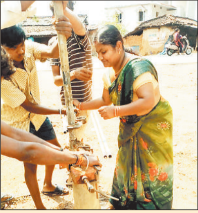
अलग-अलग ब्लॉक में पदस्थ हैं और गांव के गलियों में खराब हैडपंप सुधार करने कभी भी पहुंच

अब तक आप पुरुष तकनीशियनों को ही हैडपंप सुधार करते देखे होंगे, लेकिन यदि महिला के हाथ में हैडपंप टूल किट नजर आए और गांव के किसी गली में खराब हैडपंप सुधार करते देखे तो आश्चर्य होने का नहीं है। क्योंकि अब पुरुष प्रधान कार्यों में महिलाओं की भागीदारी भी बढ़ रही है। इसी भागीदारी को निभा रही हैं जिले के तीन ब्लॉकों में पदस्थ महिला तकनीशियन। दरअसल जिले के तीन ब्लॉकों में महिला तकनीशियनों की नियुक्ति की गई है। तीनों