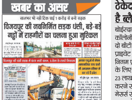
प्रमुखता से खबर प्रकाशित किया था। जिससे निगम प्रशासन की काफी किरकरी हुई थी। ऐसे में निगम प्रशासन अब नीच से जाग गया है। बारिश समाप्त होने के बाद ही