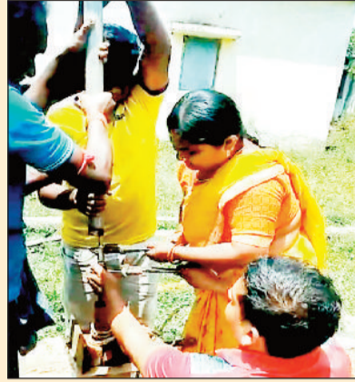
जाते हैं। पीएचई में इन महिला तकनीशियनों की भर्ती हुई है। महिला तकनीशियनों की सरकारी भर्ती