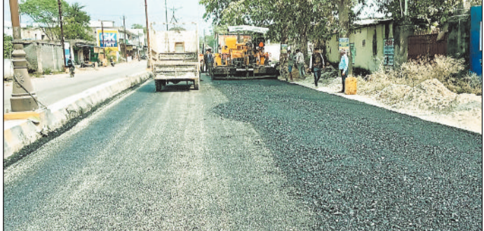
शिकार हो रहे थे। इसके अलावा पेट्रोल पंप के पास फिर से बड़ा गड्ढा हो गया था जो हादसों को न्यौता दे रहा था। रात के समय इस मार्ग में अंधेरा होने पर दुपहिया चालक

हरिभूमि में जर्जर सड़क को लेकर लगातार खबर प्रकाशित के बाद नगर निगम प्रशासन नींद से जाग गया है। बोर्डरदादर से विजयपुर तक सड़क के गड्ढों को भरने के लिए नगर निगम ने पैचवर्क का काम शुरू कर दिया है। जिससे स्थानीय लोगों सहित राहगीरों के चेहरे खिले नजर आ रहे हैं। दरअसल बोर्डरदादर से विजयपुर चौक व इंदिरा विहार तक नवनिर्मित सड़क में गुणवत्ताहीन निर्माण के कारण 6 माह में जगह-जगह बड़े-बड़े गड्ढे निकल आए थे। इडेन गार्डन रीजिडेंस के सामने तो सड़क पूरी तरह धंस गई थी। जिसमें वाहनों के पहिए फंस रहे थे और लोग दुर्घटना के भी